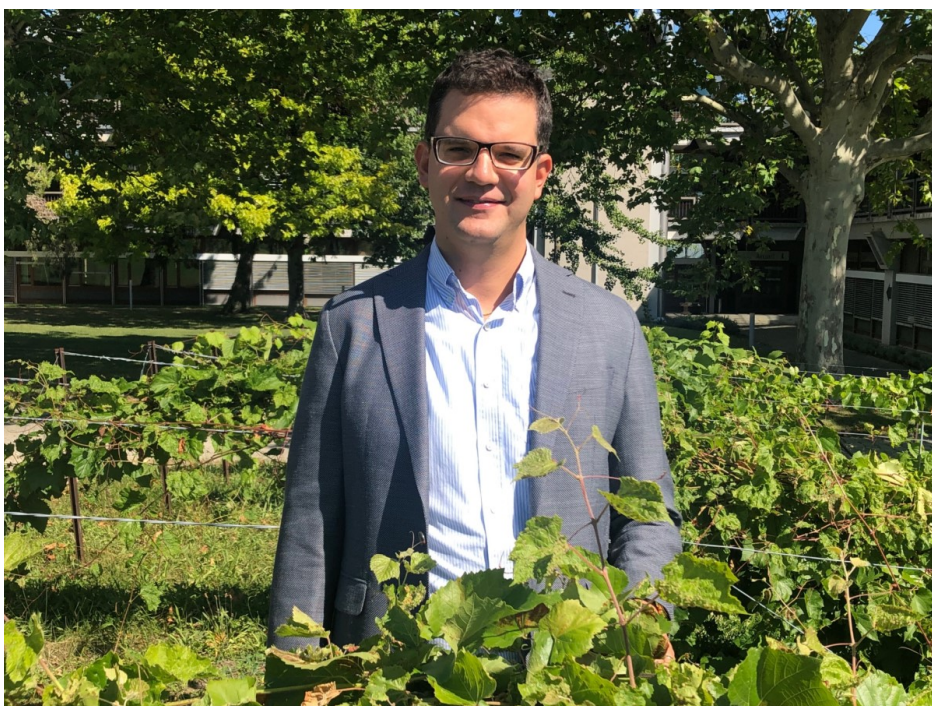
A la Une